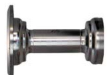
Kellerverbinder Typ A / M / S