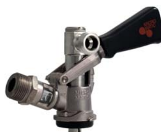
Zapfkopf Typ S (Korb), mit seitlichem Anschluss