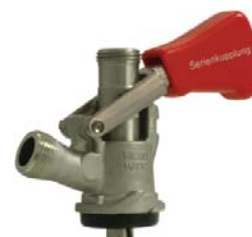
Zapfkopf Typ S (Korb), Serienkupplung