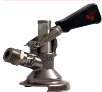
Zapfkopf Typ A (Flach)