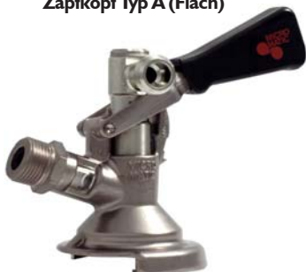
Zapfkopf Typ A (Flach), mit seitlichem Anschluss