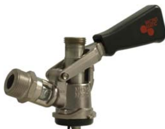
Zapfkopf Typ S (Korb)