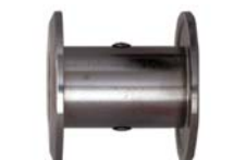
Kellerverbinder Typ A/M