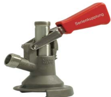
Zapfkopf Typ A (Flach), Serienkupplung