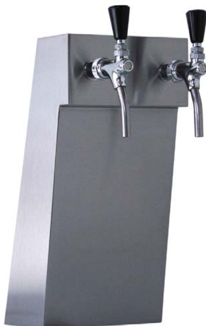
Zapfsäule »WIEN«, Edelstahl matt, 2-leitig