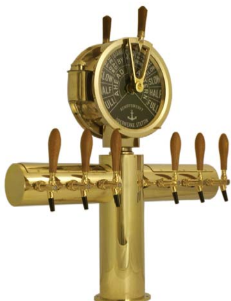
Zapfsäule „Maschinentelegraph“, T-Form, 6-leitig