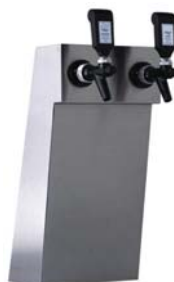
Zapfsäule »WIEN«, Edelstahl matt, 1 und 2-leitig