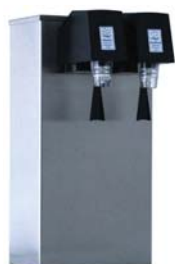
Zapfsäule »BERLIN«, Edelstahl matt, 1 und 2-leitig