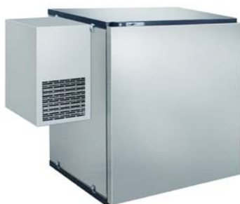
Fassvorkühler MKC 4, Edelstahl, Aggregat links