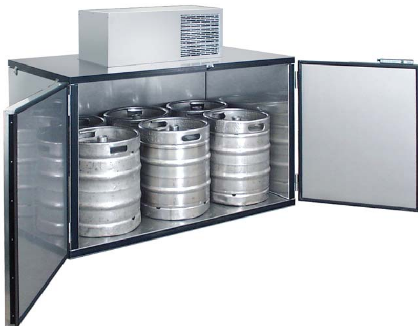
Fassvorkühler MKC 6, Edelstahl